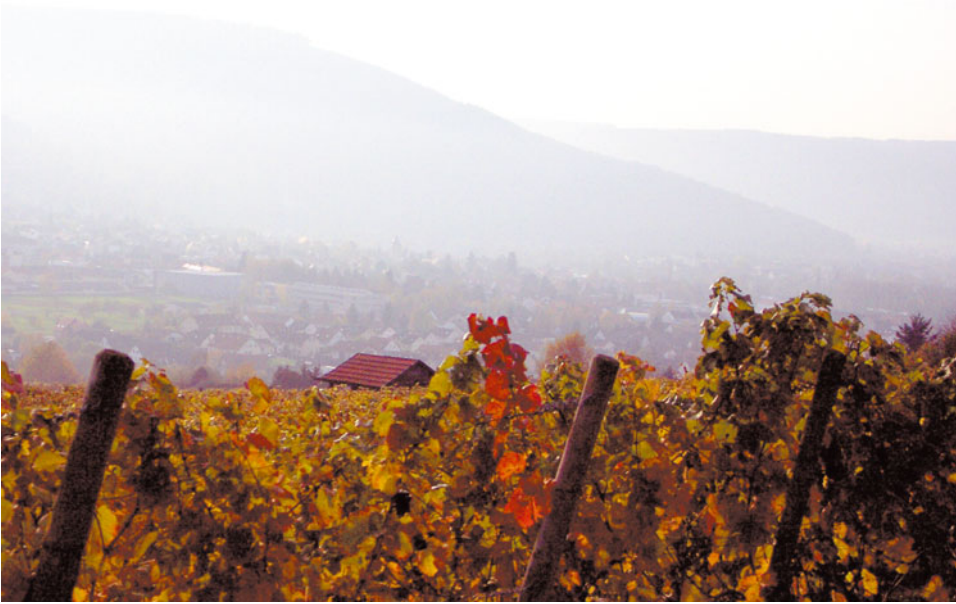
Abb. 1.4: Herbstfarben

Der Herbst sorgt für neue Akzente: Die zuvor leuchtenden Farben werden durch den Nebel gedämpft. Im Oktober bestimmen Rostbraun und Ocker das Bild.