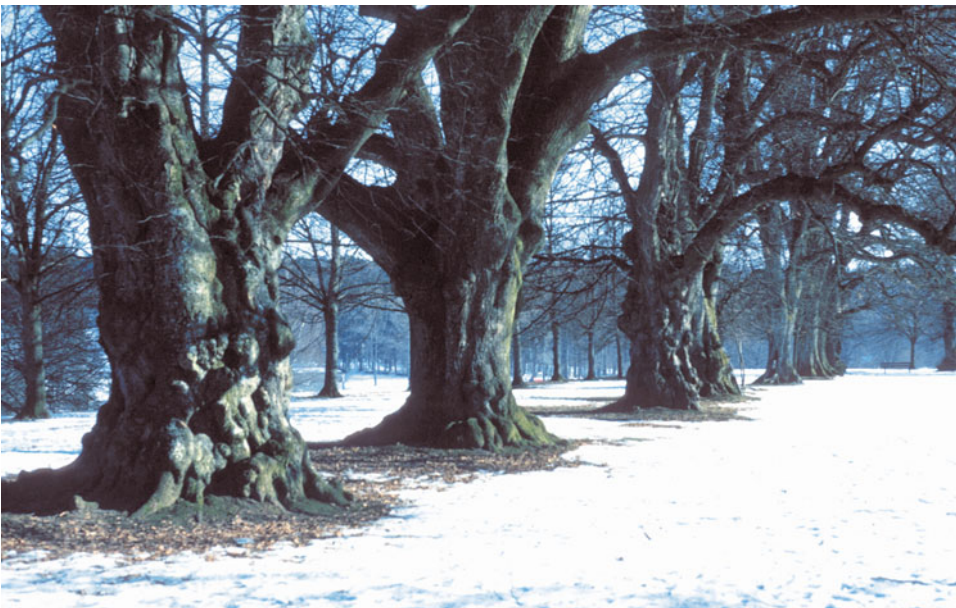
Abb. 1.5: Winterfarben

Der Herbst sorgt für neue Akzente: Die zuvor leuchtenden Farben werden durch den Nebel gedämpft. Im Oktober bestimmen Rostbraun und Ocker das Bild.