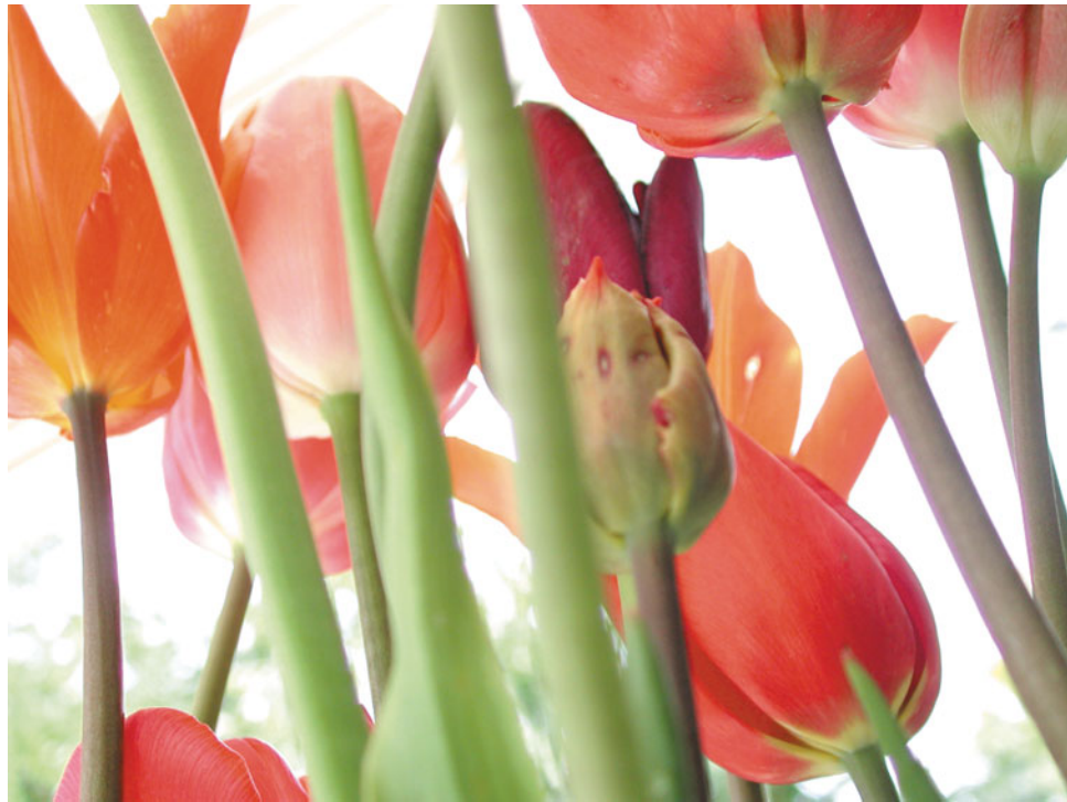
Abb. 1.2: Frühlingsfarben

Der Frühling bringt mit den jungen Trieben leuchtende Grüntöne hervor. Passend dazu das saftige Gelb der Narzissen und das feurige Orange der Tulpen.