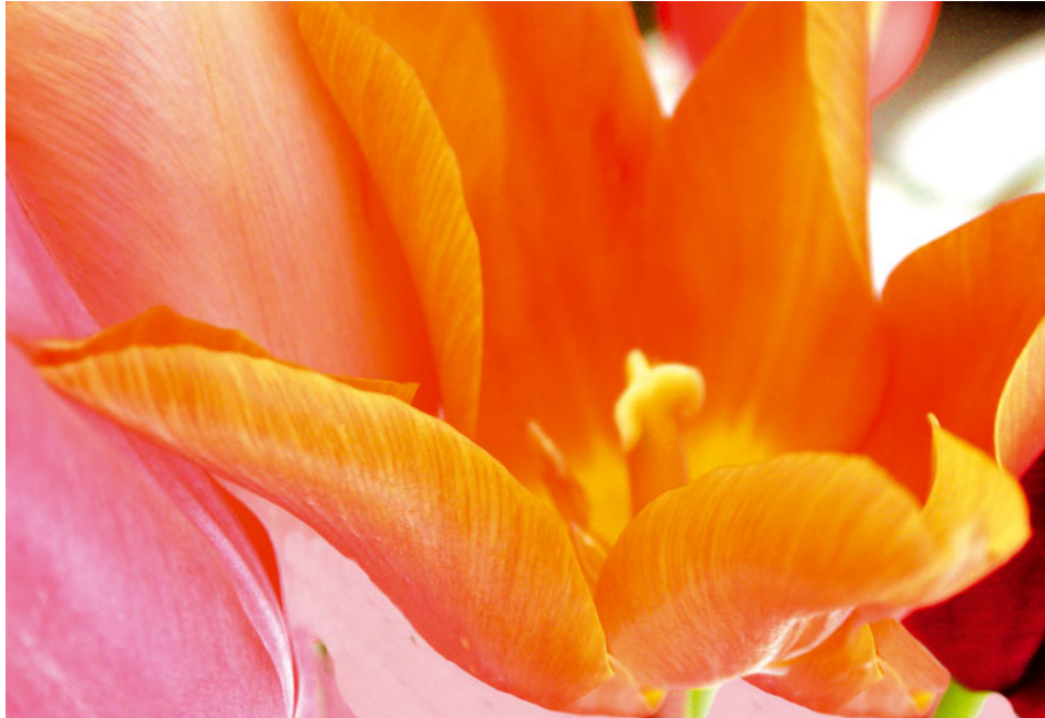
Abb. 1.6: Warmtonige Farben

Warmtonige , sonnendurchflutete, gelbliche Farbtöne: Bei diesen Farben wird man unweigerlich an die warme, gelbe Sonne erinnert.