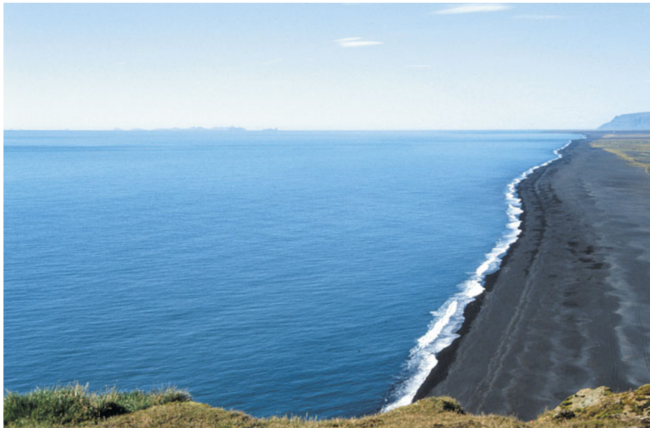
Abb. 1.7: Kalttonige Farben

Warmtonige , sonnendurchflutete, gelbliche Farbtöne: Bei diesen Farben wird man unweigerlich an die warme, gelbe Sonne erinnert.